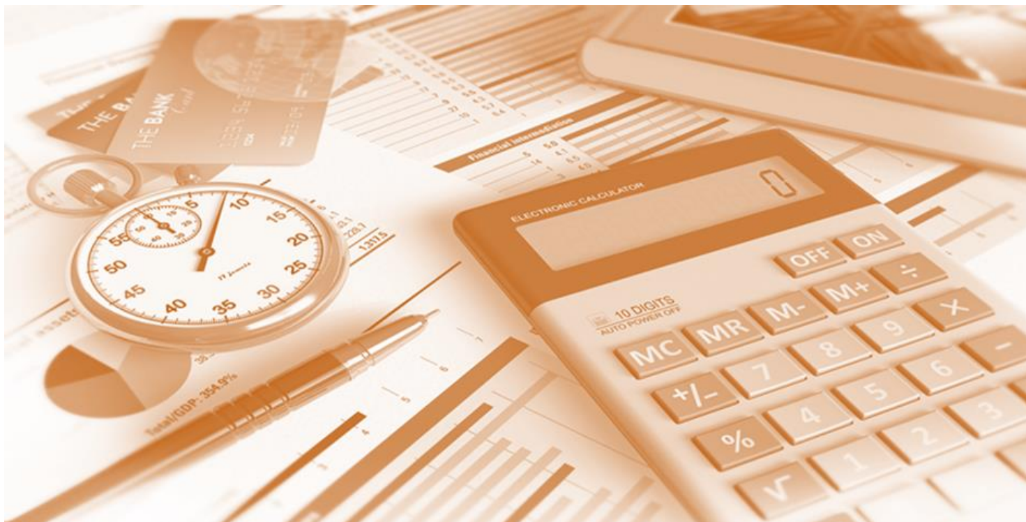
График на направление „Вътрешен контрол”