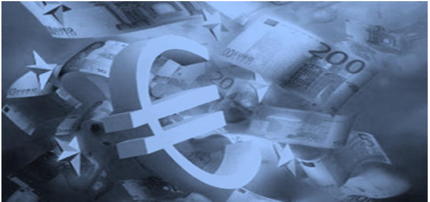
График на направление „Структурни инструменти на Европейския съюз”