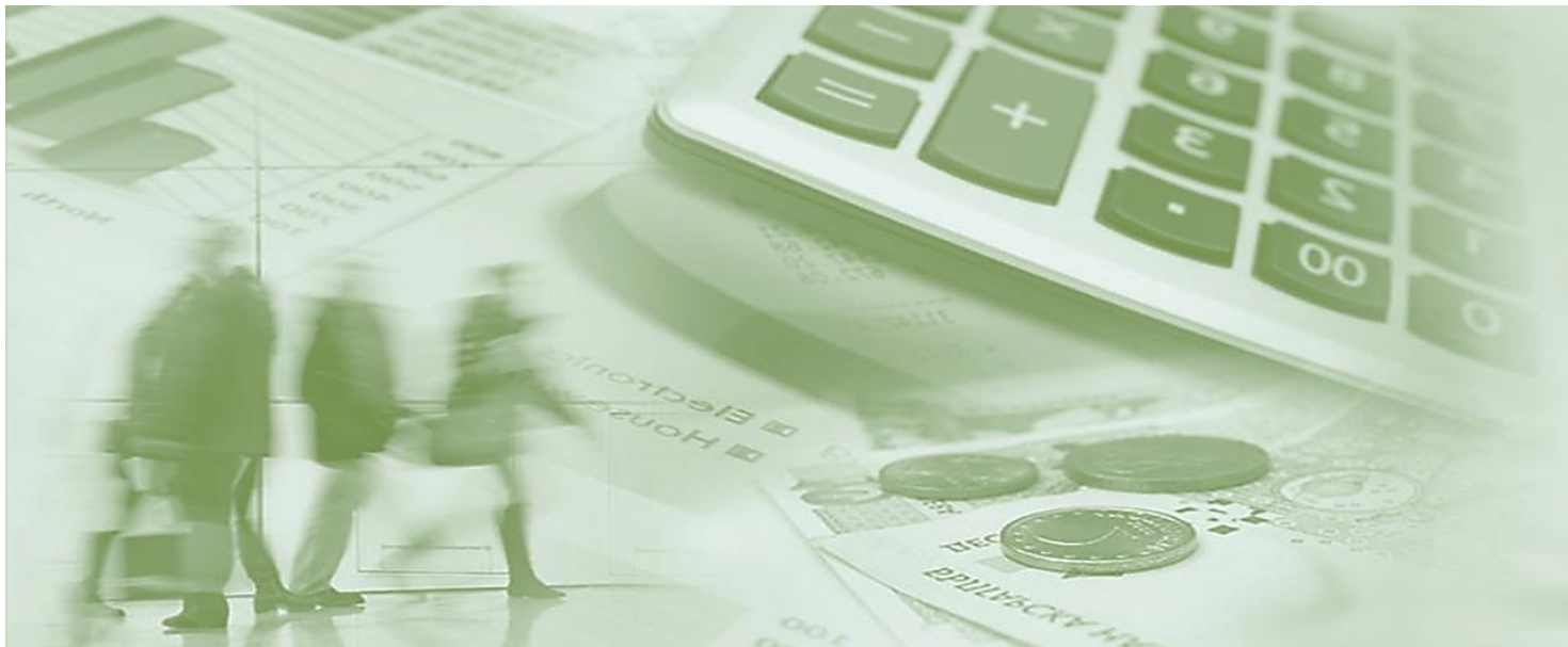
График на направление „Бюджет и финансово управление”