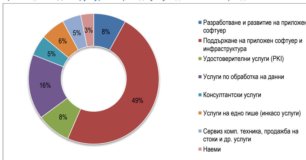
Графика 1. „ИО” АД – Структура на приходи услуги/дейности за периода 01.01. – 30.09.2017 г.

Относителният дял на приходите по видове услуги/дейности в общо приходите е както следва: