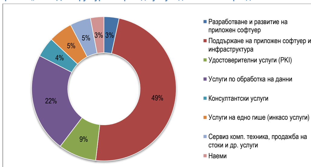
Графика 1. „ИО“ АД – Структура на приходи услуги/дейности за периода 01.01. – 30.06.2017 г.

Относителният дял на приходите по видове услуги/дейности в общо приходите е както следва: