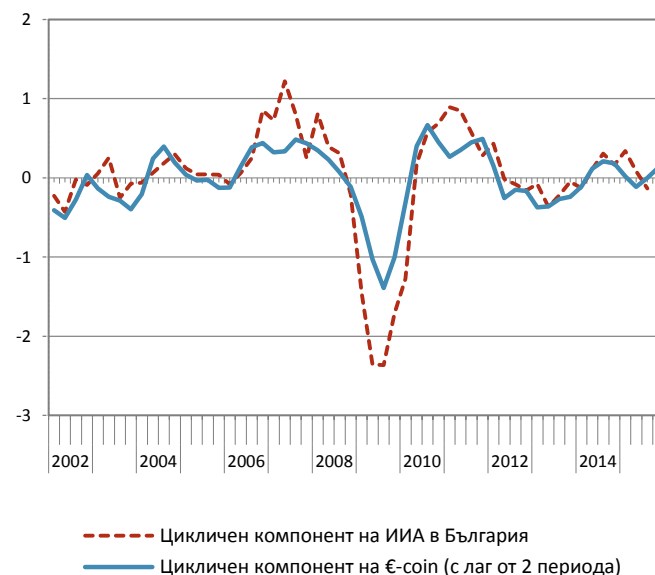
Оценени циклични колебания в еврозоната и България

През третото тримесечие на 2015 г. индикаторът €-coin достигна най-високата си стойност за периода от средата на 2011 г. насам, което се обуславяше от активизирането на външната търговия в страните от еврозоната. През октомври и ноември 2015 г. се наблюдаваше слабо забавяне в развитието на разглеждания показател, като основният ограничаващ фактор бе свързан с все още ниската инфлация. Въпреки това, неговата стойност остана висока, в съответствие с подобряване на доверието на фирмите и домакинствата. От тази гледна точка, очакванията за развитието на бизнес цикъла у нас през последното тримесечие на 2015 г. и началото на 2016 г. остават положителни. ●